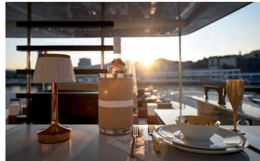
Auf der Fly Bridge laden Designer-Bar und ein exklusiver Loungebereich zu unvergesslichen Momenten unter freiem Himmel ein.