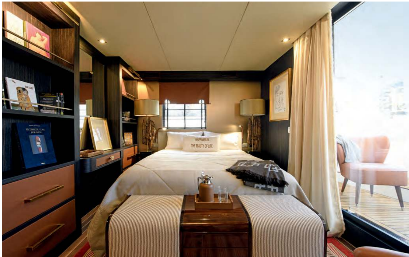
Der Luxus der 17 Quadratmeter großen Master-Kabine wird von einer privaten Terrasse mit Außendusche gekrönt.